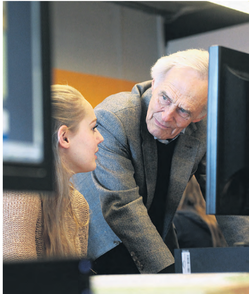
„Telkens als je een gesprekspartner iets positiefs kunt meegeven, is dat een bouwsteen voor een betere wereld.’

„Bij een reis naar de VS heb ik Miller opge-